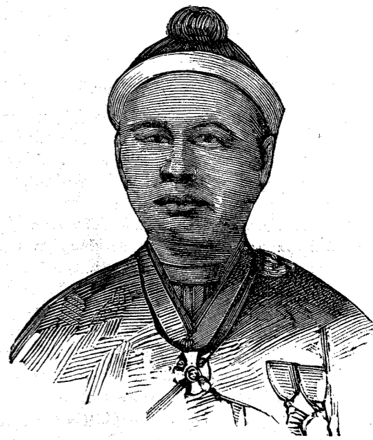
ΝΑΪΤ ΑΝΤΖΙΑ ὑπουργός τῶν Ἐξωτερικῶν τῆς Βιρμανίας.

Ἡ ἑτέρα εἰκονογραφία τοῦ Νάϊτ Ἀντζία παριστᾷ τὸν ὑπουργὸν τῶν ἐξωτερικῶν τῆς Βιρμανίας. Καὶ οὗτος ἐταξείδευσε εἰς Εὐρώπην, καὶ ἐκόσμηθη διὰ διαφόρων παρασήμων.