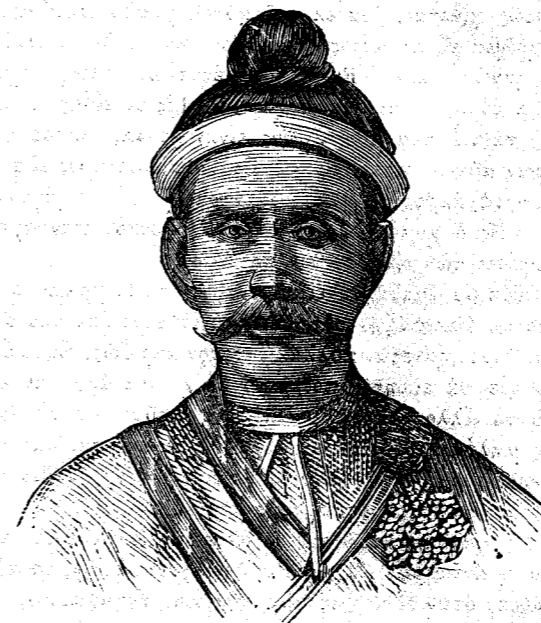
ΘΑΪΤ-Ο-ΣΧΕΕ , πρωθυπουργός τῆς Βιρμανίας.

Ὁ Σεκουκούνης λοιπὸν οὗτος, οἰαδ' ἴησθε καὶ ἂν ᾖ ἡ καταγωγή του, διέπραττε πρὸ ἑτῶν ληστείας, φιλοξενῶν εἰς τὴν ἐξ ἀποτόμων βράχων περιζωσμένην πρωτεύουσάν αὐτοῦ συμμορίας ἀνθρώπων ἐξ ὅλων τῶν φυλῶν, αἵτινες προσήρχοντο εἰς αὐτὴν φεύγουσαι ἐνεκα ἐρίδος τοῦς πρότερον ἀρχηγούς των.